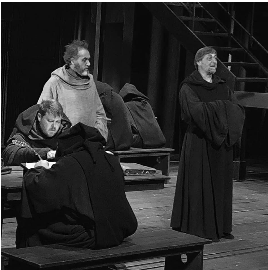
"Il nome della rosa", regia di Leo Muscato, tournée 2017/18