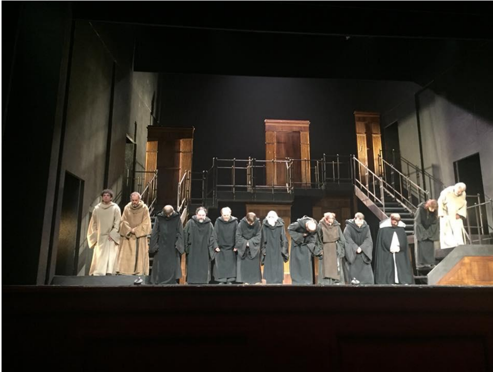
"Il nome della rosa", regia di Leo Muscato, tournée 2017/18